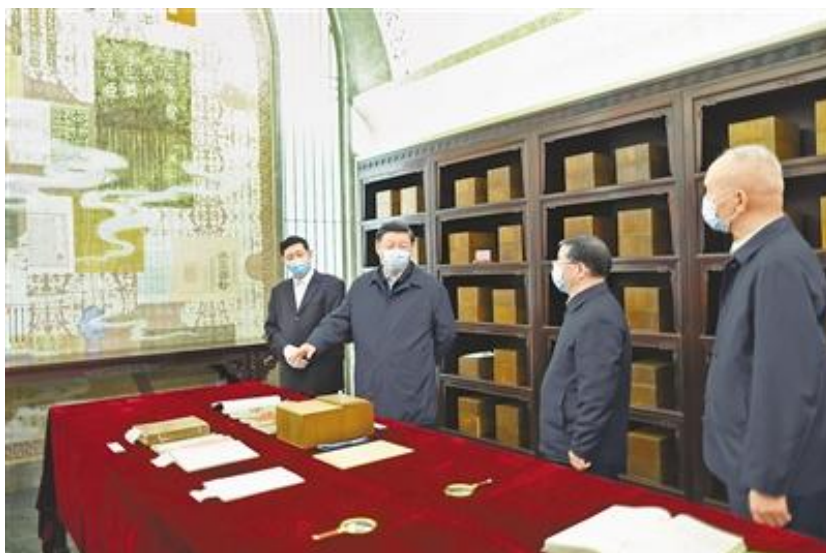
6月2日，中共中央总书记、国家主席、中央军委主席习近平在北京出席文化遗产发展座谈会并发表重要讲话。这是座谈会前，习近平1日下午在中国国家版本馆考察时，在兰台洞库了解馆藏精品版本保存情况。