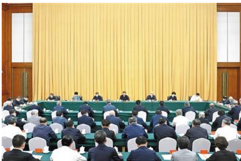
6月2日，中共中央总书记、国家主席、中央军委主席习近平在北京出席文化遗产发展座谈会并发表重要讲话。