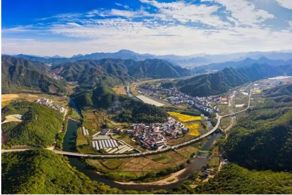
浙江浦江大畈乡诗人小镇风光

“浦江经验”是习近平同志在浙江工作期间亲自倡导、亲自谋划、亲自下访接待群众的好做法好经验，也是一项一举多得的有益创举。经过 20 年的发展，以“ 变群众上访为领导下访，深入基层，联系群众，真下真访民情，实心实意办事 ”为主要内容的“浦江经验”依然展现出强大生命力，并且不断彰显出历久弥新、弥足珍贵的时代价值和真理光芒。“浦江经验”是我们在新时代新征程上 做好信访工作、推进信访工作现代化的重要指引 。